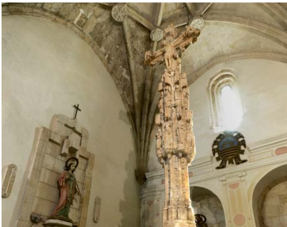
Virgen románica y Cruz de Alabastro, iglesia de Santiago Apóstol