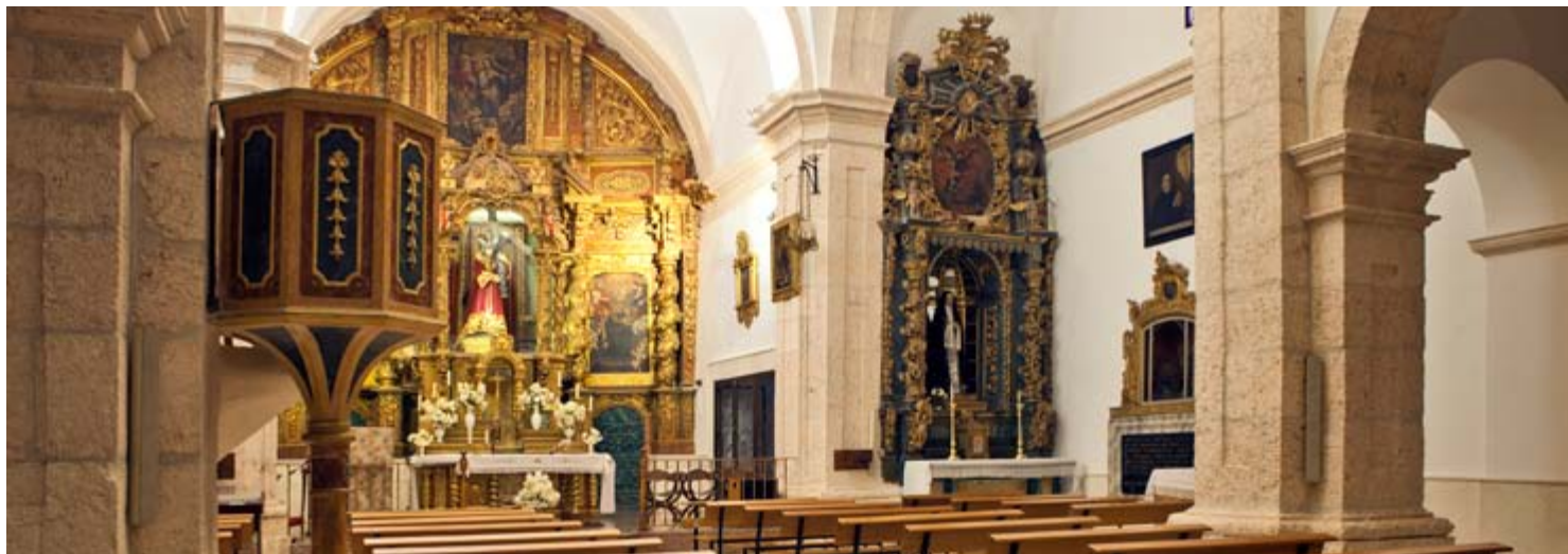
Convento de las Madres Clarisas, Sisante

llamativa portada principal y espectaculares retablos. En el interior la magnífica talla de Nuestro Padre Jesús Nazareno, obra de 'La Roldana', una escultura tricentenaria que está entre las más importantes de la imaginería española y que procesiona cada cien años. Las pinturas murales y la capilla del Rosario son los atractivos de la parroquia de Santa Catalina (siglos XV-XVII) y del Ayuntamiento lo es su briosa torre, con