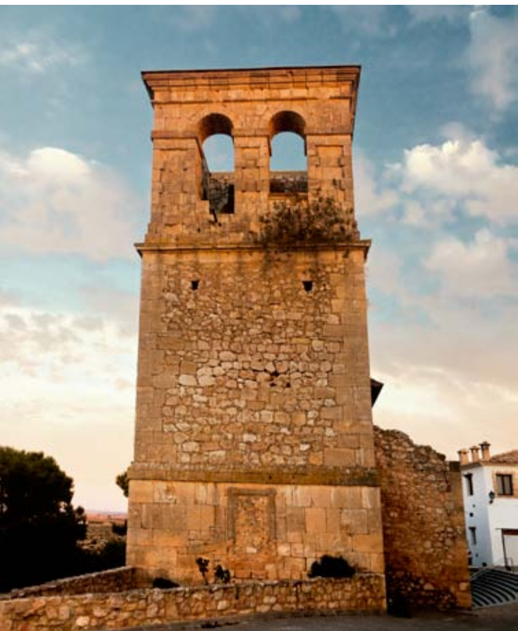
Iglesia de Santo Domingo, Alarcón

A través de la CU-802, la CU-807 y la N-III se llega a Alarcón . Sin hipérbolos, es lisa y llanamente uno de los pueblos más hermosos de España. La localidad se sitúa en un farallón rocoso abrazado por un meandro del río Júcar en las inmediaciones del embalse. Una bucólica estampa que enmarca esta villa medieval y fortificada de calles empedradas, conjunto compacto donde los siglos son belleza. Un viaje en el tiempo sin apenas concesión a los anacronismos. Un monumento total y plural. Su magnífico Castillo tiene una llamativa Torre del Homenaje. Fundado en el siglo VIII, es fruto del mestizaje de diversas épocas y estilos y ac-