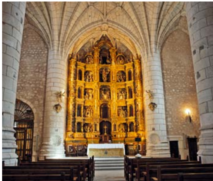
Iglesia de Santa María, Alarcón

El conjunto fortificado de Alarcón, al borde del Júcar, es una de las localidades más hermosas de España