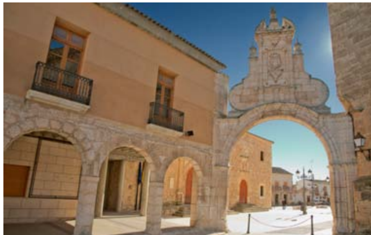
Arco romano, San Clemente

El Museo de Obra Gráfica acoge una valiosa colección de autores contemporáneos como Lucebert y Saura