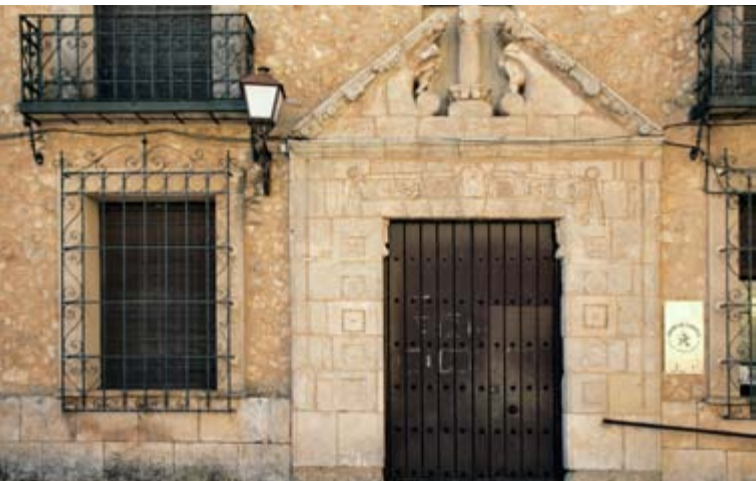
Antigua cárcel, San Clemente

La antigua cárcel, un inmueble del siglo XVIII, acogerá un original museo provincial dedicado a las artes decorativas navideñas y otro a la Virgen de Rus, advocación mariana muy venerada en la comarca. La Torre