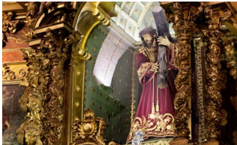
Talla del Nazareno, Convento de las Madres Clarisas, Sisante

La N-310 deja al viajero en Sisante , una combinación de interesante arquitectura popular manchega con edificios excepcionales. Uno de ellos es el Convento de las Madres Clarisas (siglo XVIII), con una detallista y