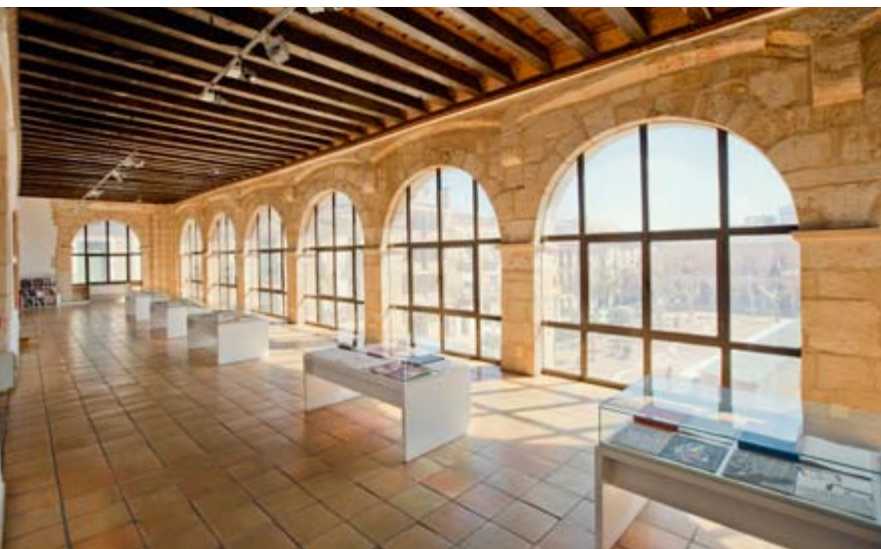
Museo Fundación Antonio Pérez. Antiguo ayuntamiento, San Clemente

Excepcional es su Plaza Mayor, donde la escena está dominada por el porticado antiguo Ayuntamiento, cuyo interior contiene el Museo de obra gráfica de la Fundación Antonio Pérez, que alberga una colección de arte contemporáneo con obras de artistas como Saura, Feito o Lucebert.