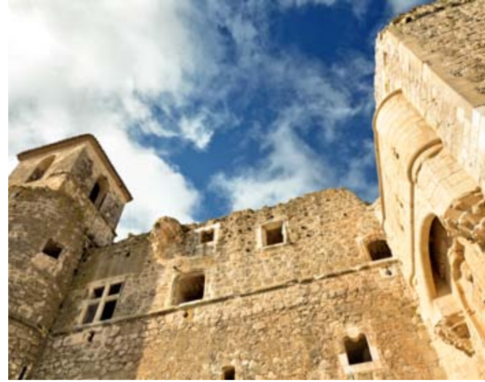
Castillo de Garcimuñoz

Recuerde el alma dormida, avive el seso y despierte... Los versos con que se inician las celebérrimas “Coplas” de Jorge Manrique vienen a la memoria del viajero al contemplar el Castillo de Garcimuñoz , donde fue herido de muerte el poeta. Es una curiosa fortaleza de proporciones armoniosas que en el siglo XV adquirió su forma actual y a la que se adosó posteriormente la iglesia parroquial de San Juan Bautista. El conjunto se ha rehabilitado recientemente.